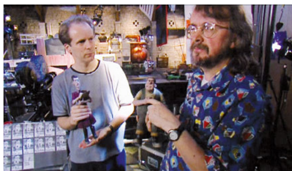
Peter Lord et Nick Park sur le tournage de Chicken Run en 1999

Nick Park et Peter Lord, les réalisateurs de Chicken Run , sont les deux artistes les plus admirés d'un des plus célèbres studios de cinéma d'animation du monde : Aardman, en Angleterre. Leurs personnages vivent grâce à la technique de la claymation : modelés dans une pâte nommée plasticine, ils sont animés en « stop motion », image par image. Parmi eux, un bricoleur génial et son chien, les célèbres Wallace et Gromit ( Une grande excursion , 1989), ont fait le tour du monde et ont rapporté deux Oscars à leur créateur Nick Park ( Un mauvais pantalon , 1993, et Rasé de près , 1995). L'Avis des animaux , court métrage où des bêtes enfermées dans un zoo disent leur désir de retrouver leur milieu naturel, avait connu le même succès en 1989. Premier long métrage du studio, né après plus de quatre années de travail, Chicken Run annonçait en 2000 ses grands titres du 21 e siècle : Pirates ! Bons à rien, mauvais en tout (2012), Shaun le mouton (2015 puis 2019) ou Cro Man (2018). Ginger et Rocky ont eu une brillante descendance !